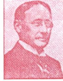
F. W. Taylor