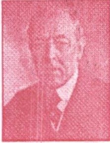
Thomas Woodrow Wilson