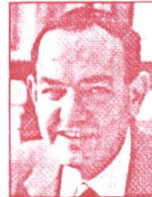
Herbert A Simon