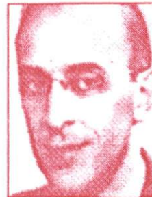
A H Maslow