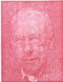
Chester Irving Barnard